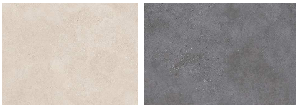
(RAKO Betonico odstín světle béžová, odstín černá)

Podlahy ve wellness části budou provedeny z keramické dlažby. V prostoru sprch z mozaiky, která zajistí dostatečný protiskluz povrchu. V prostoru šaten, občerstvení a denních odpočíváren je navržena keramická dlažba a obklad v odstínu světle béžové, formát 600/600 mm (např. RAKO Betonico, světle béžová) . V prostoru saun a přilehlých umývárkách je navržena keramická dlažba odstínu černé formát 600/600 mm, keramický obklad odstín černá formát 600/300 mm (např. RAKO Betonico černá). v pomocných prostorech bude použit vinyl. V prostoru fitness bude doplněna PVC podlahovina v části pak bude provedena podlaha z dopadové gumy. Rozsah jednotlivých podlahových krytin je vyznačen ve výkresové části – D.1.5.b.01 Spárořez podlah.